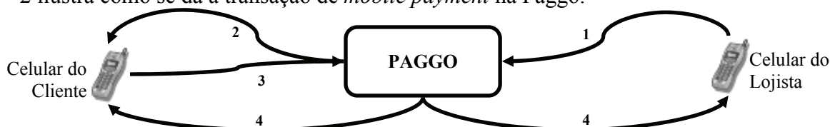
Figura 2: fluxo da transação de crédito da Paggo

As transações são feitas por mensagem de texto no celular (SMS) do cliente e do lojista. Para que ocorra, é premissa básica que ambos estejam credenciados junto à administradora – neste caso a Paggo –, como ocorre no cartão de crédito tradicional. A Figura 2 ilustra como se dá a transação de mobile payment na Paggo.